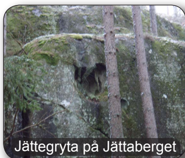
Jättegryta på Jättaberget