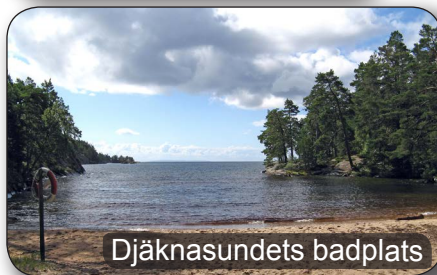
Djäkna sundets badplats