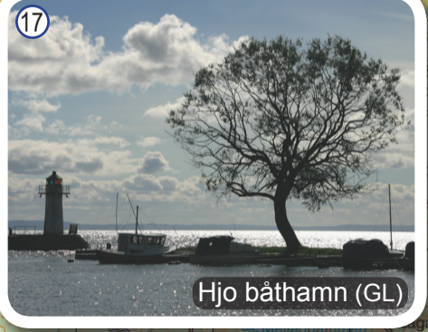
Hjo båthamn (GL)