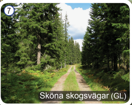
Sköna skogsvägar (GL)