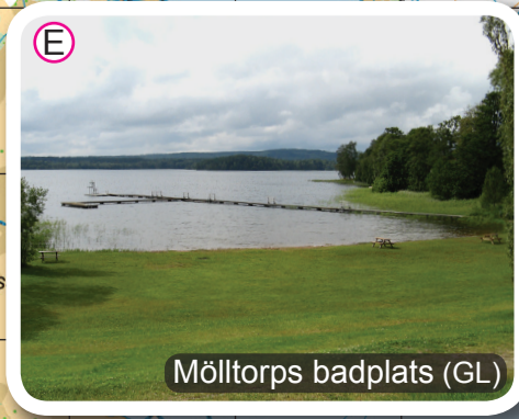
Mölltorps badplats (GL)