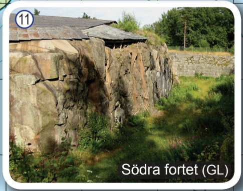
Södra fortet (GL)