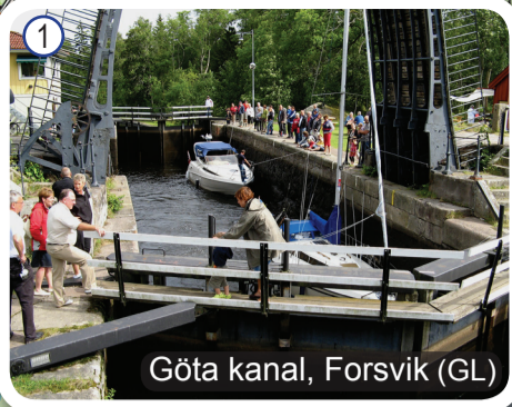
Göta kanal, Forsvik (GL)