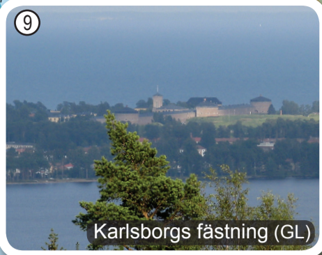
Karlsborgs fästning (GL)