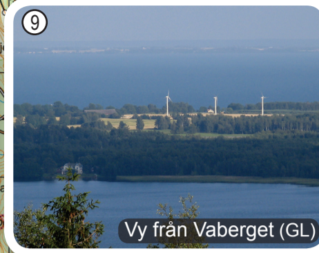
Vy från Vaberget (GL)